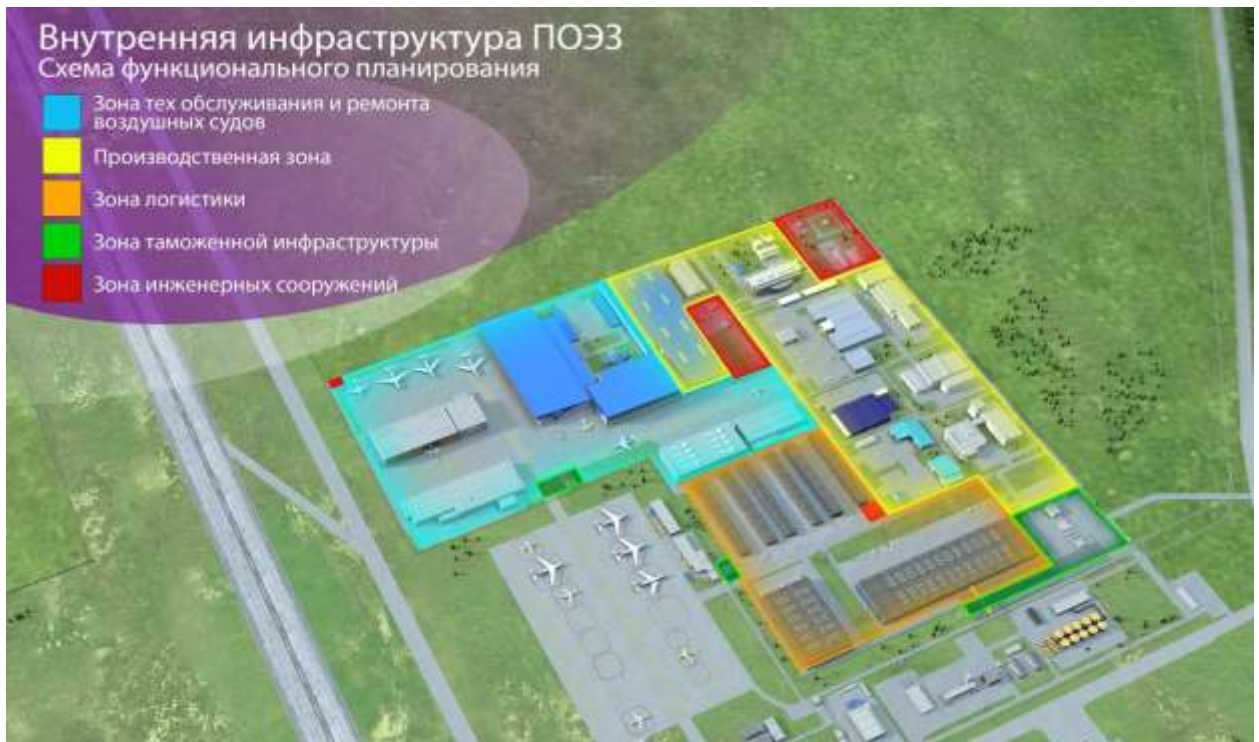
Рис. 1.2. Схема функционального зонирования ПОЭЗ (1-й пусковой комплекс)

Ещё в начале 2014 года было принято решение о расширении территории ПОЭЗ.