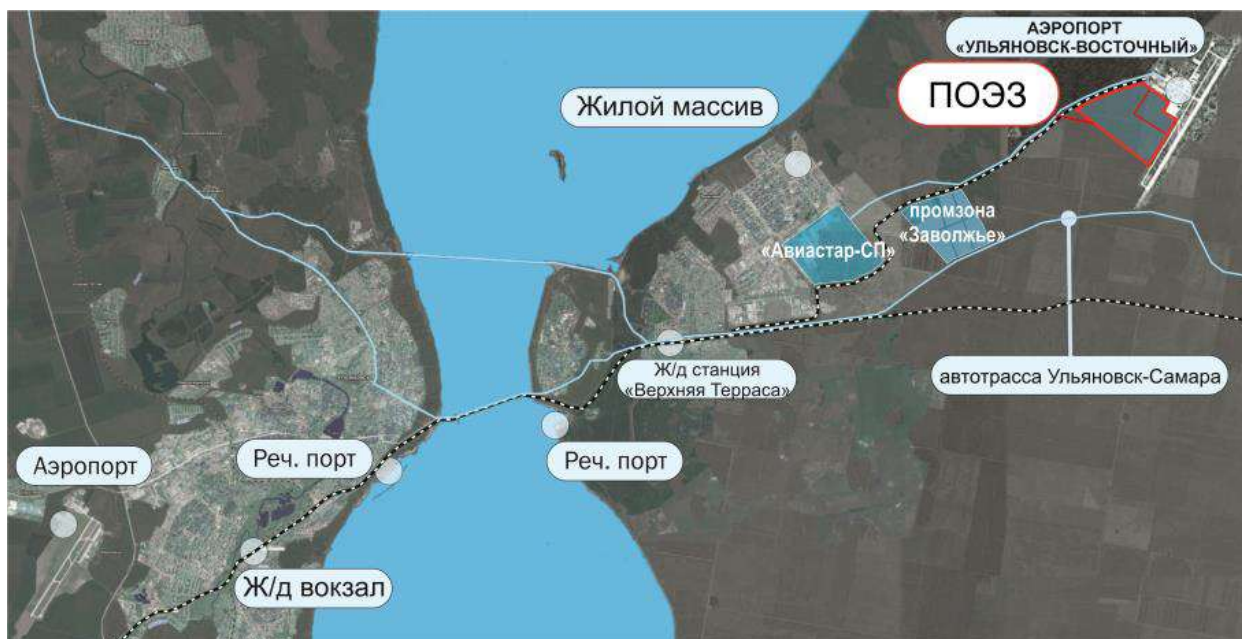
Рис. 1.1. Местоположение ПОЭЗ на территории Ульяновской области